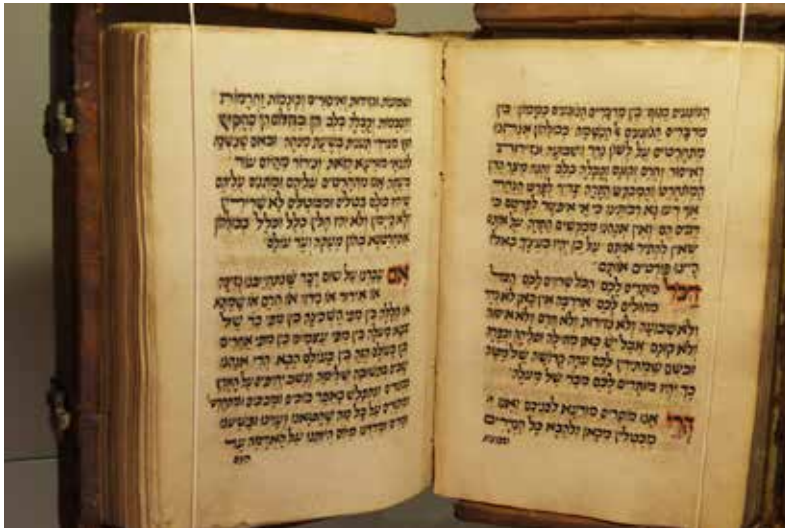
Σεφαραδίτικο προσευχολόγιο της Υεμένης.

καρδιάς σας”. Τι εστί λατρεία της καρδιάς – ερωτούν οι Σοφοί; Προ- σευχή – είναι η απάντηση. Όμως, ο αριθ- μός, η μορφή και το περιεχό- μενο των προ- σευχών, καθώς και ο χρόνος απαγγελίας αυ- τών, δεν καθο- ρίζεται στην Το- ρά! 19