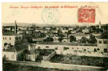
Αποψη της Αλεξανδρούπολης σε καρτ ποστάλ του 1910

Η Συναγωγή υπέστη ζημιές από βομβαρδισμό στη διάρκεια του πολέμου και στη συνέχεια χρησιμοποιήθηκε για τη στέγαση οικογενειών προσφύγων 8 , ενώ στα μεταπολεμικά χρόνια στεγάζει κατηχητικά σχολεία και τη «Χριστιανική Εστία». Στα 1958 το κτίριο μεταβιβάστηκε με πωλητήριο 9 στη Γ.Ε.Χ.Α. και «υπέστη σημαντικές τροποποιήσεις... σε βαθμό που μόνο οι εξωτερικοί τοίχοι παραμένουν στην αρχική τους μορφή» 10 . Κατά τον Ηλία Μεσσίνα, οι τροποποιήσεις, που έγιναν από το μηχανικό Γεώργιο Γιουβανάκη, περιλάμβαναν μετάθεση του αρχικού δαπέδου χαμηλότερα από την