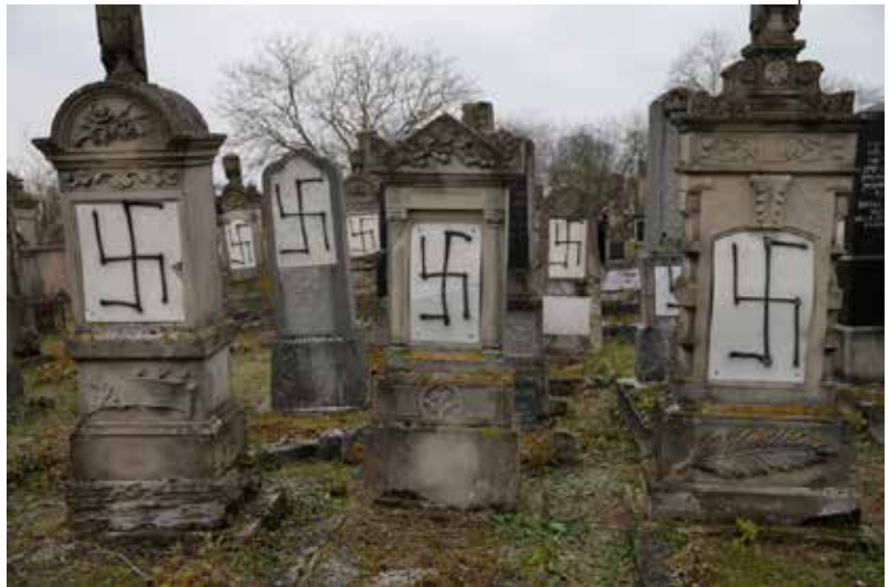
Τον περασμένο Φεβρουάριο περισσότεροι από 80 τάφοι βεβηλώθηκαν με ναζιστικά σύμβολα και αντισημιτικά συνθήματα στο εβραϊκό νεκροταφείο του Quatzenheim, μιας μικρής πόλης στην Αλσατία, λίγες ημέρες πριν τα συλλαλητήρια καταδίκης του αντισημιτισμού που έγιναν σε όλη τη Γαλλία.

Πηγάζει από την χριστιανική αντίθεση στον Ιουδαϊσμό. Αυτός οδηγεί σε διωγμούς υπό διάφο-