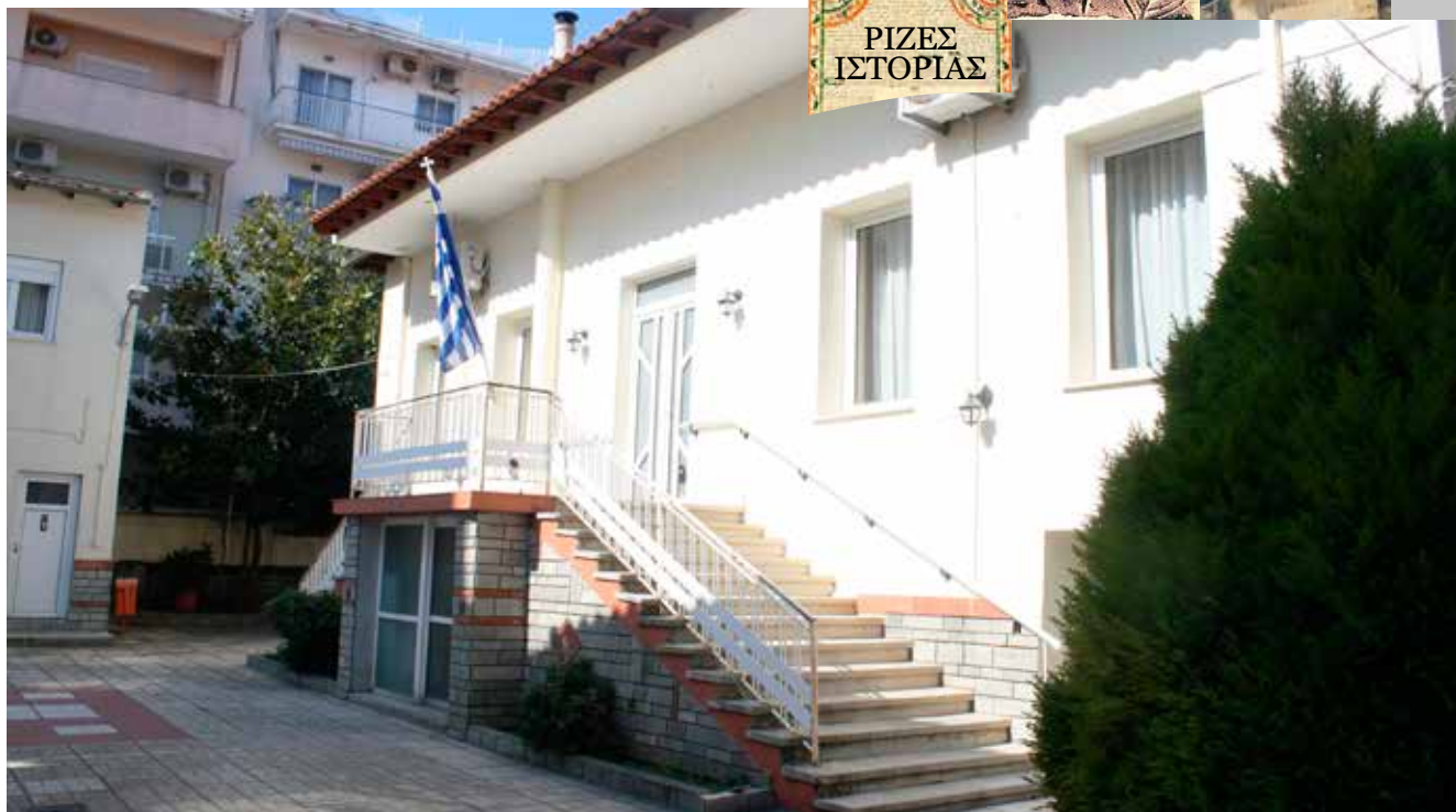
Το κτίριο της τ. Συναγωγής της Αλεξανδρούπολης, στην οδό Μαζαράκη 33, όπου σήμερα στεγάζεται η Χριστιανική Εστία.