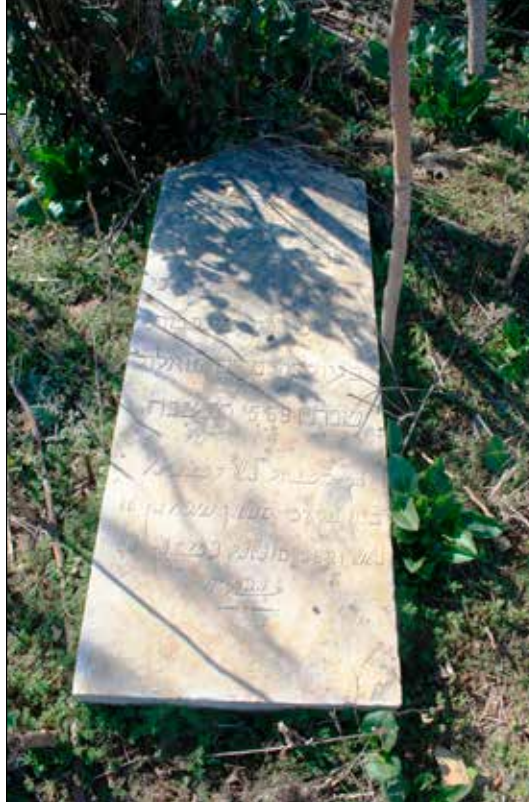
Ταφικά μνήματα που διασώζονται μέχρι σήμερα στο εβραϊκό νεκροταφείο της Αλεξανδρούπολης, που βρίσκεται σε πάροδο της οδού Κεσσάνης, στη θέση Τυφλό, στο Ο.Τ.713 του Πολεοδομικού Σχεδίου.