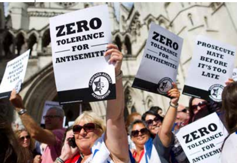
Εβραϊκές οργανώσεις έξω από τα Βασιλικά Δικαστήρια Δικαιοσύνης στο Λονδίνο καλούν για «μηδενική ανοχή στον αντισημιτισμό».