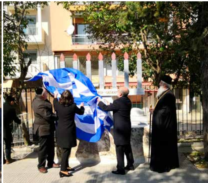
Στιγμιότυπα από τα αποκαλυπτήρια του Μνημείου. Οι τοπικές αρχές, η πρέσβυς του Ισραήλ, εκπρόσωποι του Ελληνικού Εβραϊσμού και απόγονοι της οικογένειας Brownstone.

μόλις 75 χρόνια αφότου η ανθρωπότητα αντίκρισε την πιο απεχθή βιομηχανία θανάτου στο Άουσβιτς-Μπιρκενάου: Βανδαλισμοί Μνημείων του Ολοκαυτώματος, Εβραϊκών νεκροταφείων και συναγωγών, και αντιεβραϊκά συνθήματα. Στο Πίτσμπουργκ δολοφονούνται αθώοι άνθρωποι την ώρα της προσευχής, επειδή γεννήθηκαν Εβραίοι. Και εδώ στη χώρα μας, αρνητές του Ολοκαυτώματος είναι υποψήφιοι δήμαρχοι και παρουσιάζουν ξανά και ξανά, να το 2019, τα λιβελογραφήματά τους, προσπαθώντας να ξαναγράψουν την ιστορία και να εξαγνίσουν τους εμπνευστές και τους εκτελεστές του μεγαλύτερου εγκλήματος κατά της ανθρωπότητας». Ο Γ.Γ. του ΚΙΣΣΕ ολοκλήρωσε την ομιλία του επισημαίνοντας ότι «Το μνημείο αυτό υπενθυμίζει τι μπορεί να συμβεί ξανά στην ανθρωπότητα εάν η μνήμη σβήσει και εάν το μίσος επικρατήσει ως ανεκτός κανόνας σε μια κοινωνία».