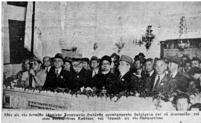
Χθές εις την ενταύθα εβραϊκὴν Συναγωγὴν ἐτελέσθη μεγαλοπρεπὴς δοξολογία ἐπὶ τῇ ἀνακηρύξει τοῦ νέου ανεξαρτήτου Κράτους τοῦ Ἰσραὴλ εἰς τὴν Παλαιστίνην. («ΕΘΝΟΣ» 17 Μαΐου 1948)