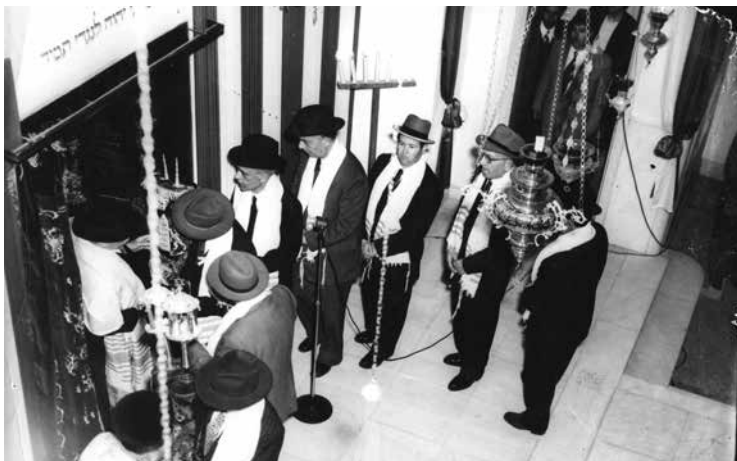
Μία φωτογραφία ἀπὸ τὴν χθεσινὴν εορτὴν εἰς τὴν ενταύθα Συναγωγὴν ἐπὶ τῇ πρώτῃ ἐπετείῳ τῆς ἰδρύσεως τοῦ Ἰσραηλιτικοῦ Κράτους. («ΕΘΝΟΣ» 5 Μαΐου 1949)