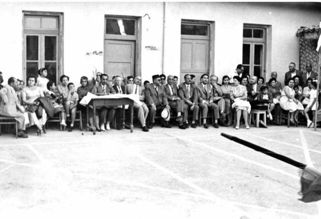
1958, γυμναστικές επιδείξεις Εβραϊκού Σχολείου Αθηνών.