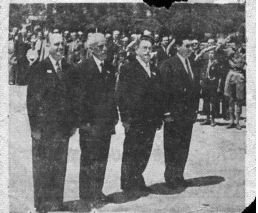
Οι εκπρόσωποι των Εβραίων προ του Μνημείου του Αγνώστου Στρατιώτου, όπου κατέθεσαν στέφανον επί τη χθεσινή 1η επέτειο της ανακηρύξεως του Κράτους του Ισραήλ.