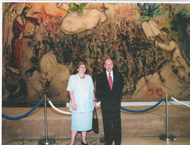
Ο Πρόεδρος κ. Στεφανόπουλος και η Αναπληρώτρια ΥΠΕΕ κα Παπαζώη στην Κνέσσετ μπροστά σε έργο του Μάρκ Σαγκάλ.

ιστορικοί δεσμοί ανάμεσα στον Ισραηλινό και τον Ελληνικό λαό, αλλά και η κοινή επιθυμία για σύσφιξη των σχέσεων με συνεργασία σε πολλά επίπεδα, στον κοινό χώρο της Μεσογείου, ένα χώρο στον οποίο και οι δύο χώρες καλούνται και δύνανται να παίξουν σημαίνοντα ρόλο.