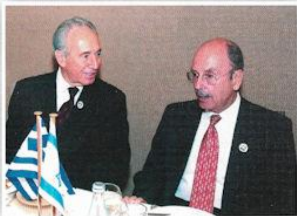
Ο Πρόεδρος κ. Στεφανόπουλος και ο Υπ. Περιφερειακής Συνεργασίας του Ισραήλ κ. Πέρεζ στο Οικονομικό Φόρασμα.

Οι επισκέψεις του Έλληνα Προέδρου κ. Κωστή Στεφανόπουλου σε σημαντικά μνημεία, τα οποία συνδέονται με την ιστορική μνήμη και την ίδια την υπόσταση του Ισραηλινού Κράτους, ήταν εξίσου σημαντικές με τις πολιτικές του συναντήσεις. Συγκεκριμένα, ο κ. Στεφανόπουλος, κατά την παράδοση που ακολουθούν όλοι οι επίσημοι που επισκέπτονται το Ισραήλ, επισκέφθηκε το Μουσείο Μνήμης του Ολοκαυτώματος, Γιάντ Βασέμ, στην Ιερουσαλήμ, αποτίοντας φόρο τιμής στα θύματα των στρατοπέδων συγκέντρωσης. Μια από τις πιο συγκινητικές στιγμές της επίσκεψης του Προέδρου της Δημοκρατίας στο Ισραήλ, ήταν όταν κατά την ξενάγησή του στο Γιάντ Βασέμ έγινε ιδιαίτερη αναφορά στους Έλληνες Εβραίους που έπεσαν θύματα της ναζιστικής θηριωδίας.