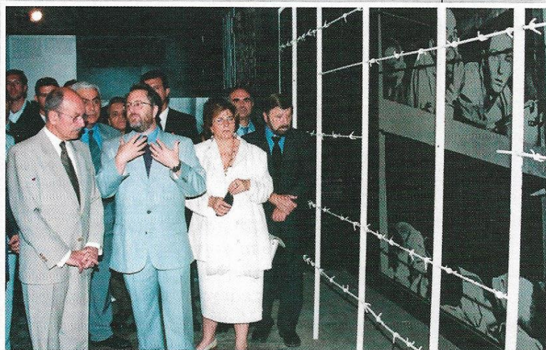
Ο Πρόεδρος κ. Στεφανόπουλος στο Γιαντ Βασέμ.

ιστορικοί δεσμοί ανάμεσα στον Ισραηλινό και τον Ελληνικό λαό, αλλά και η κοινή επιθυμία για σύσφιξη των σχέσεων με συνεργασία σε πολλά επίπεδα, στον κοινό χώρο της Μεσογείου, ένα χώρο στον οποίο και οι δύο χώρες καλούνται και δύνανται να παίξουν σημαίνοντα ρόλο.