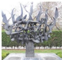
Holocaust Remembrance Day January 25, 2019 10:30 a.m.